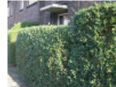
Geen zicht op de woning

Is uw tuin flink begroeid en is het zicht vanaf de straat ontnomen op de ramen en deuren, dan kunt u dit terug snoeien.