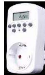
Digitale schakelklok voor gebruik binnenshuis

Maak daarin een normaal woonpatroon, zoals dat bij u gebruikelijk is.